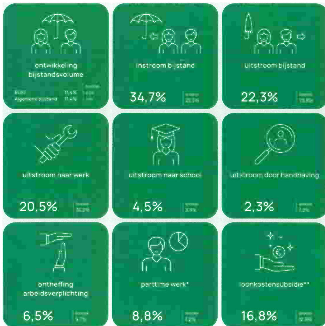
Figuur Jaarkaart Divosa benchmark 2024 voor de gemeente Hardinxveld-Giessendam